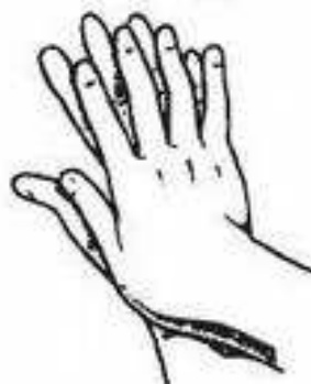
Vnitřní strany prstů se myjí takto