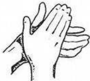
Dlaň myje dlaň