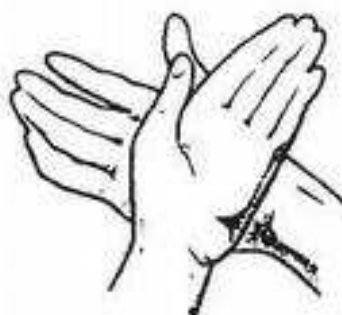
Pravá dlaň myje hřbet levé ruky