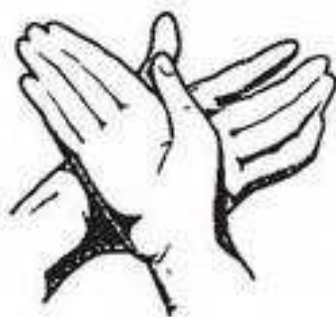
Levá dlaň myje hřbet pravé ruky