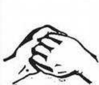
Hřbetní strana prstů v dlani druhé ruky